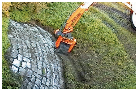
Mega Okb : ideaal voor o.a. het verwijderen van onkruid op bruggen.