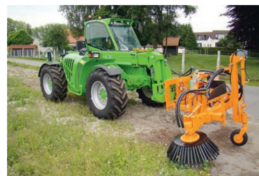
Aan verschillende types werktuigdragers.