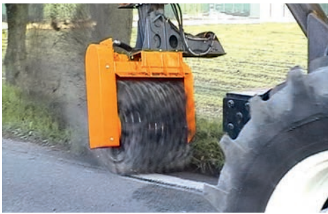
Mega Okb : voor montage op zware klepelarm of op de giek van een kraan.